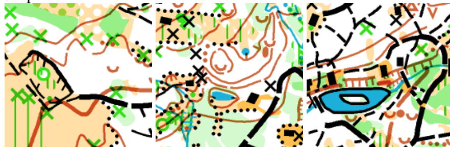
Etapa číslo 4: