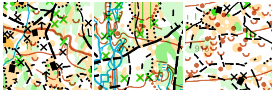
Etapa číslo 3: