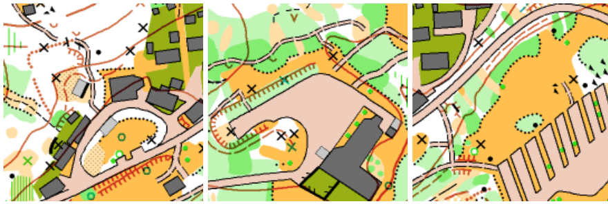
Etapa číslo 5