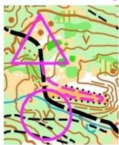
Z poslednej kontroly do ďalšieho okruhu