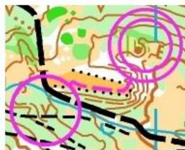
Z poslednej kontroly do cieľa