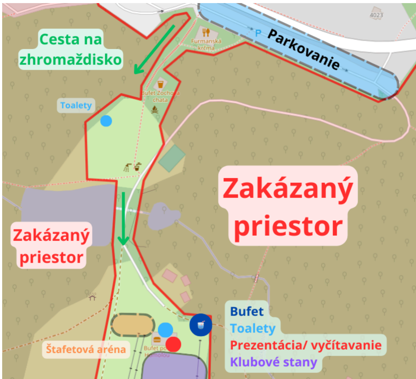
Obr. 3 Prístup na zhromaždisko a zhromaždisko. © prispievatelia OpenStreetMap