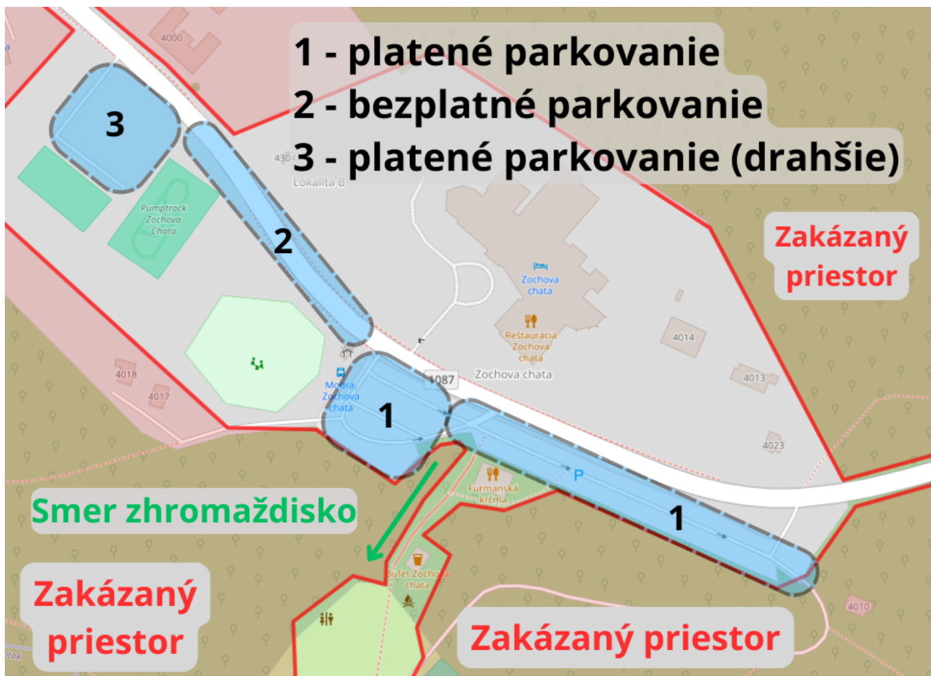
Obr. 2 Parkovanie.