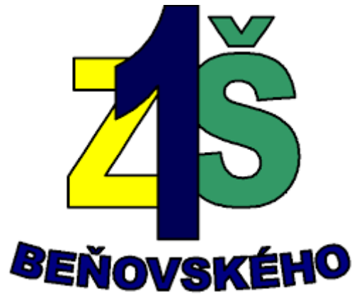
Základná škola Beňovského 1, Bratislava